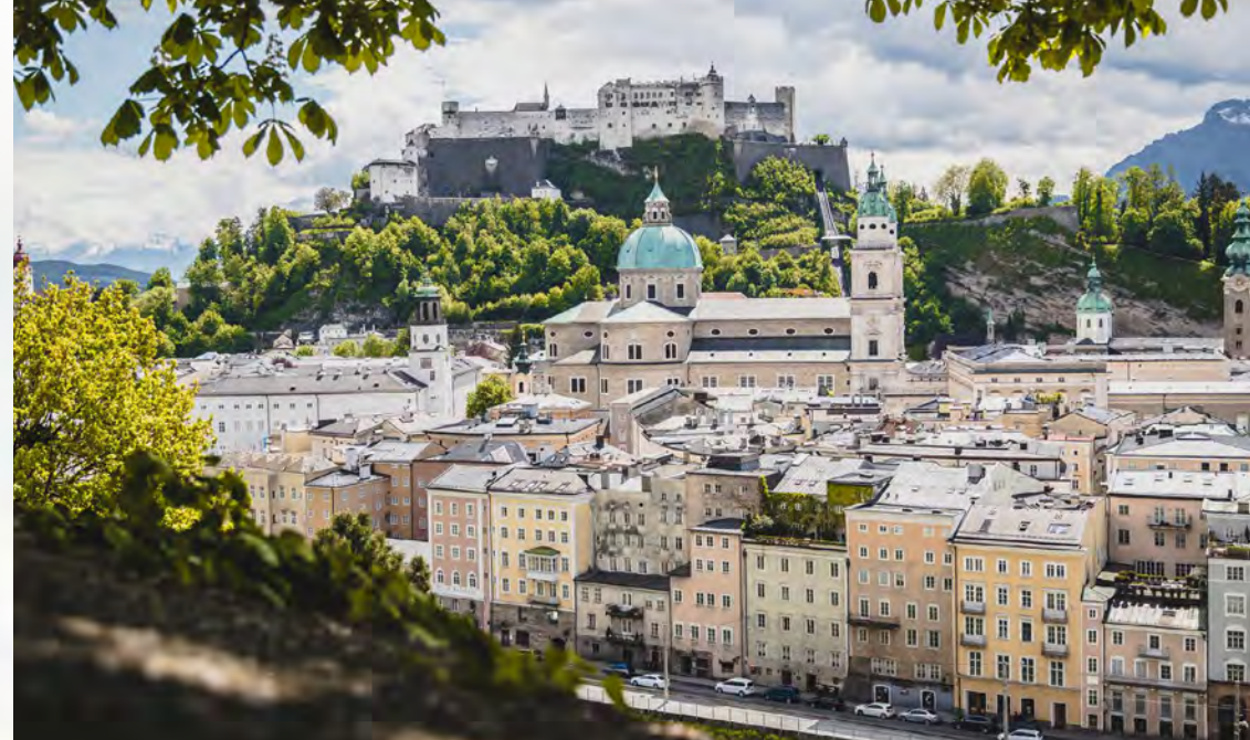
Die historische Altstadt mit Festung und Dom The historic centre with fortress and cathedral

Blick auf die Festung Hohensalzburg und die Kunstinstallation „Sphaera“ View of Hohensalzburg fortress and the art installation "Sphaera"