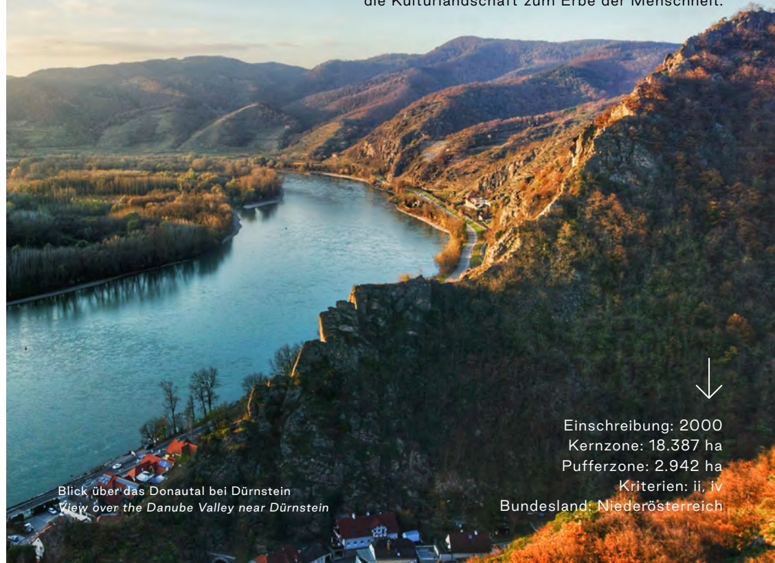
Blick über das Donautal bei Dürnstein View over the Danube Valley near Dürnstein

Was diesen „Donauraum“ einzigartig macht: Natur und Geschichte verschmelzen hier zu einer harmonischen Kulturlandschaft. Im Laufe von Jahrtausenden hat sich die Donau in das Urgestein der Böhmisches Masse eingeschnitten. Funde aus der Steinzeit bestätigen, dass der Naturraum schon sehr früh besiedelt war. In der Römerzeit verlief hier die Grenze des Imperiums. Im Mittelalter verwandelte sich die Wachau zur Kulturlandschaft: An den Hängen ließen Klöster für den Weinbau Terrassen anlegen und mit Steinmauern befestigen. Entlang der Donau entstanden Siedlungen mit Höfen, Bürgerhäusern und Kirchen. In der Barockzeit konkurrierten die Stifte Melk und Göttweig – was Pracht und Größe anbelangt – sogar mit dem Kaiserhaus. Ab etwa 1800 entdeckten Reisende schließlich die Schönheit der Wachau. Mit ihren Bildern und Beschreibungen erfanden Maler und Schriftsteller die „Donauromantik“. Auf die Künstler folgten dann die Sommerfrischler aus Wien und später Touristen aus aller Welt. Seit dem Jahr 2000 gehört die Kulturlandschaft zum Erbe der Menschheit.