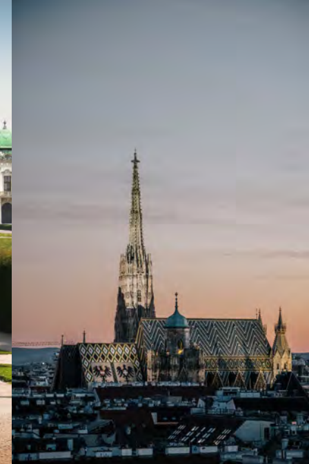
Links Oberes Belvedere, Rechts Stephansdom Left Upper Belvedere Castle, Right St. Stephen's Cathedral

Inscription: 2001 Core Zone: 371 ha Buffer Zone: 462 ha Criteria: ii, iv, vi Federal State: Vienna