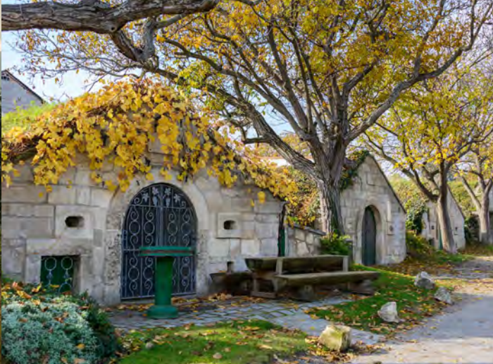
Links Blick über die Weingärten, Historische Kellergasse Rechts Left View over the vineyards, Historic wine cellars right