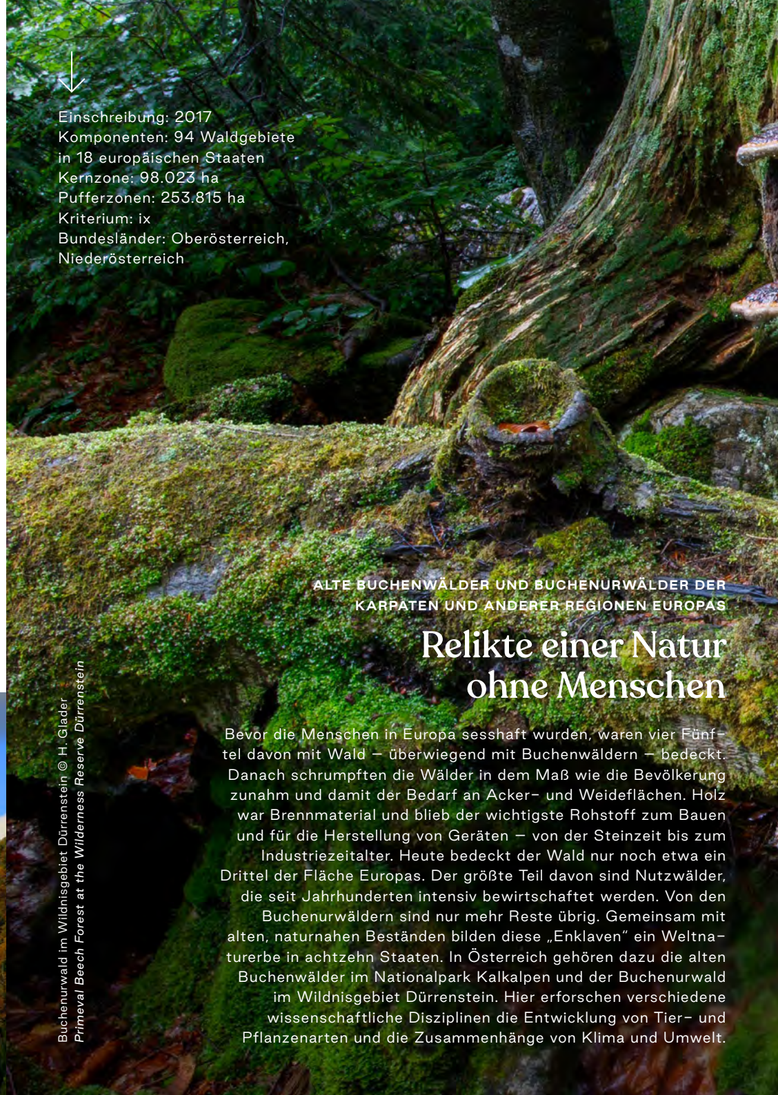
Buchenurwald im Wildnisgebiet Dürrenstein Primeval Beech Forest at the Wilderness Reserve Dürrenstein

Bevor die Menschen in Europa sesshaft wurden, waren vier Fünftel davon mit Wald – überwiegend mit Buchenwäldern – bedeckt. Danach schrumpften die Wälder in dem Maß wie die Bevölkerung zunahm und damit der Bedarf an Acker- und Weideflächen. Holz war Brennmaterial und blieb der wichtigste Rohstoff zum Bauen und für die Herstellung von Geräten – von der Steinzeit bis zum Industriezeitalter. Heute bedeckt der Wald nur noch etwa ein Drittel der Fläche Europas. Der größte Teil davon sind Nutzwälder, die seit Jahrhunderten intensiv bewirtschaftet werden. Von den Buchenurwäldern sind nur mehr Reste übrig. Gemeinsam mit alten, naturnahen Beständen bilden diese „Enklaven“ ein Weltenerbe in achtzehn Staaten. In Österreich gehören dazu die alten Buchenwälder im Nationalpark Kalkalpen und der Buchenurwald im Wildnisgebiet Dürrenstein. Hier erforschen verschiedene wissenschaftliche Disziplinen die Entwicklung von Tier- und Pflanzenarten und die Zusammenhänge von Klima und Umwelt.