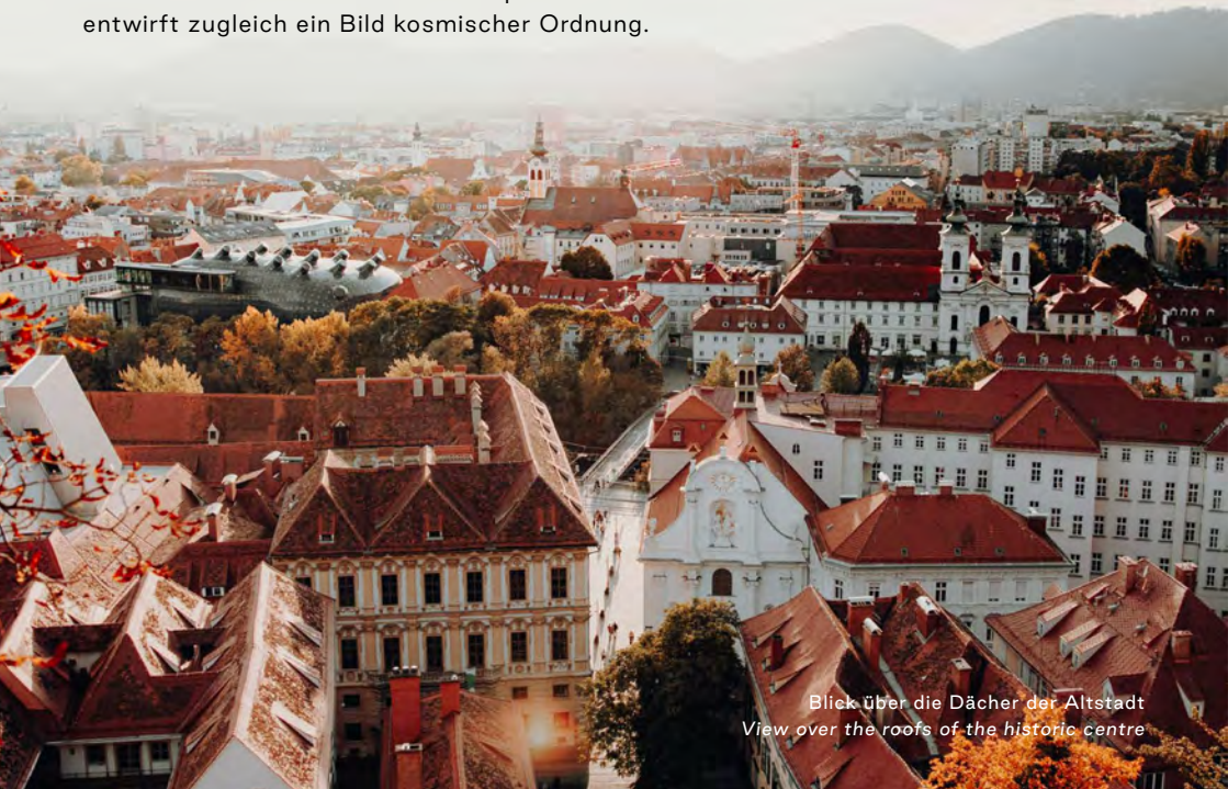
Blick über die Dächer der Altstadt View over the roofs of the historic centre

↑ Einschreibung: 1999 Erweiterung (Schloss Eggenberg): 2010 Kernzonen: 91 ha Pufferzone: 242 ha Kriterien: ii, iv Bundesland: Steiermark