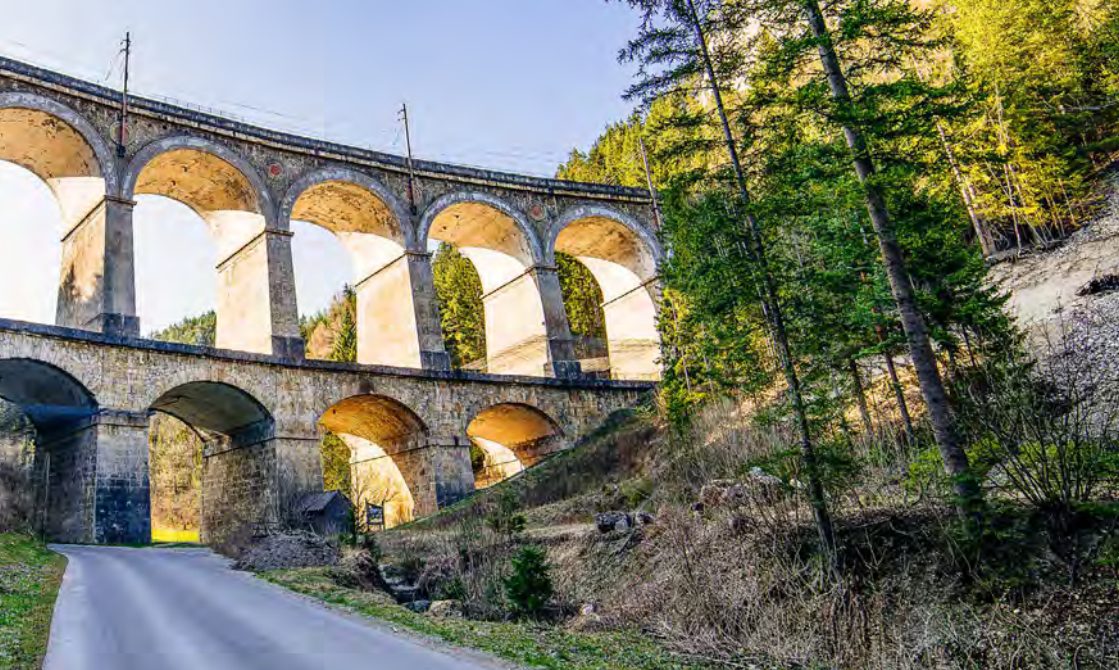
Viadukt „Kalte Rinne“, Viaduct „Kalte Rinne“