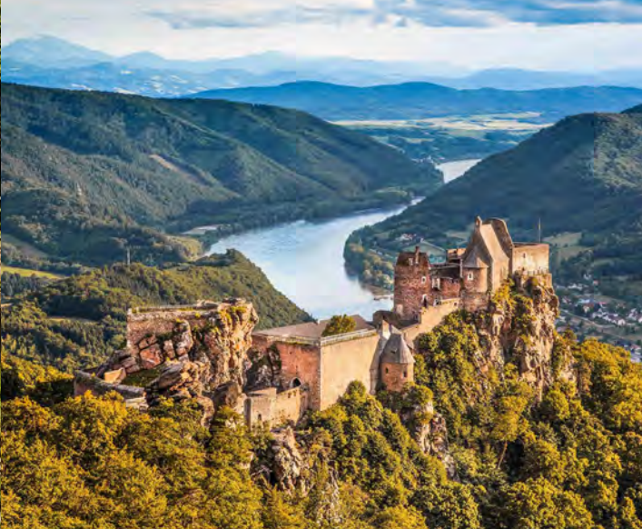
Links Historisches Ensemble in Dürnstein, Rechts Burgruine Aggstein Left Historic ensemble in Dürnstein, Right Aggstein Castle