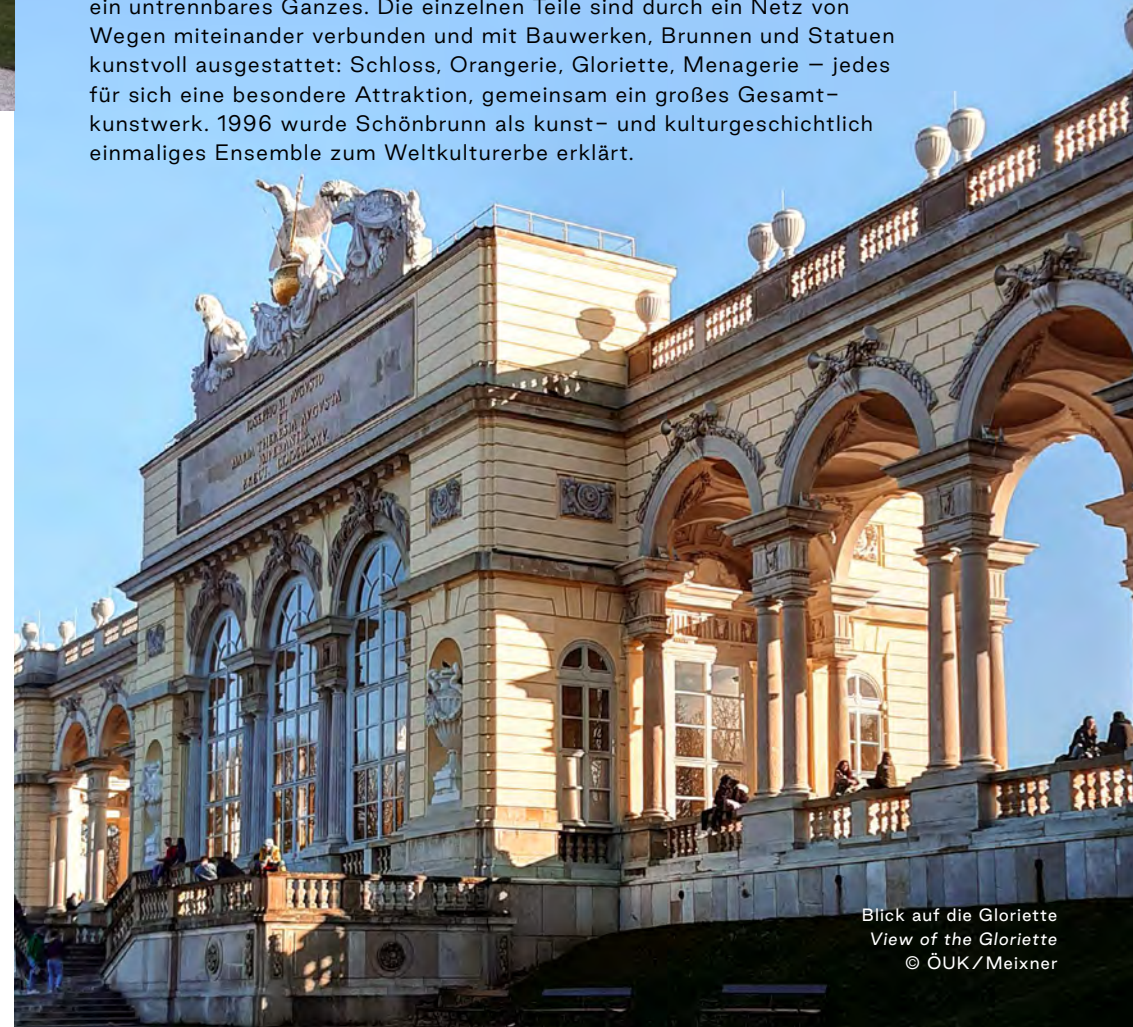
Blick auf die Gloriette View of the Gloriette

Schönbrunn steht ikonisch für Habsburg. Die Kaiser, Könige und Erzherzöge aus der Dynastie verbrachten hier drei Jahrhunderte lang die Sommer mit dem gesamten Hofstaat. Schönbrunn, das war der glanzvolle Mittelpunkt des höfischen Lebens einer der mächtigsten Dynastien Europas. Heute präsentiert sich Schönbrunn in der Form, die es am Ende der Donaumonarchie angenommen hatte. Von den ehemals dreihundert-sieben Räumen des Residenzschlosses sind noch immer vierundachtzig im Originalzustand zu bestaunen. Das Schloss und der Garten bilden ein untrennbares Ganzes. Die einzelnen Teile sind durch ein Netz von Wegen miteinander verbunden und mit Bauwerken, Brunnen und Statuen kunstvoll ausgestattet: Schloss, Orangerie, Gloriette, Menagerie – jedes für sich eine besondere Attraktion, gemeinsam ein großes Gesamtkunstwerk. 1996 wurde Schönbrunn als kunst- und kulturgeschichtlich einmaliges Ensemble zum Weltkulturerbe erklärt.